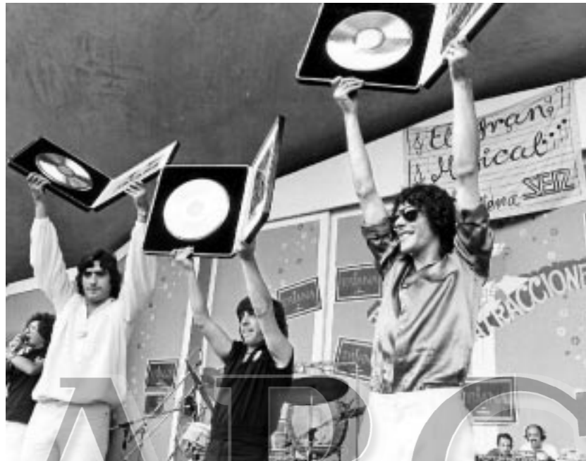
Triana recogiendo discos de oro por sus ventas de discos en el año 81

cionante. Es un montaje que tiene muchos momentos de vellos erizados».