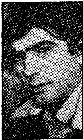
"Tropical Estress" estará dedicado al grupo Triana, en homenaje al malogrado Jesús de la Rosa.