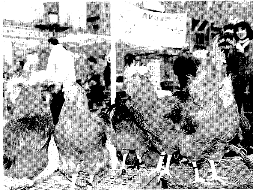
En la feria se puede adquirir el característico "gall del Penedès"

El periodista sevillano Luis Clemente presenta hoy su libro "Triana. La historia", en el que recrea la trayectoria del popular grupo musical, máximo exponente del rock andaluz, desaparecido en 1983 a raíz de la muerte de su líder, Jesús de las Rosa. Con el libro, de 200 páginas, se puede adquirir (por un precio total de 2.700 pesetas), un CD con seis de las más populares canciones del conjunto (20.30 horas. Jazz Sí Club. Requesens, 2. Barcelona).