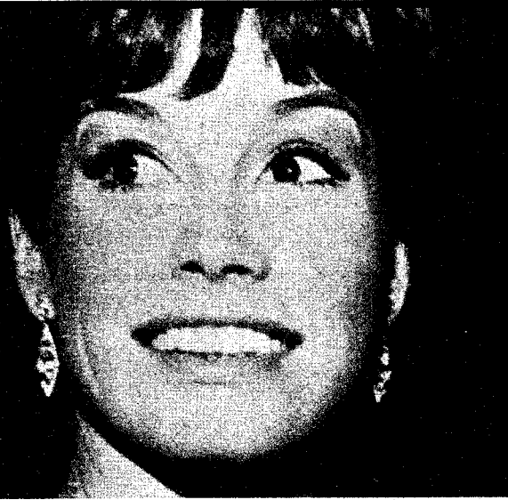
Mary Tyler Moore, protagonista de la serie de telefilmes «La chica de la tele»

N UEVO decenio, nuevo año, nuevo trimestre. En TVE, no obstante, los cambios son mínimos y todo sigue más o menos como antes. Quizá la novedad más sustancial es la aparición de una nueva franja horaria, de cuatro y veinte a cinco menos cuarto aproximadamente, que será ocupada por telefilmes de media hora. Otra incorporación es la de un nuevo programa/rio para la tarde del viernes que va a dirigir José J. Marroquí. La consecuencia más inmediata de estas modificaciones es la «asfixia» de los programas catalanes de sobremesa desde el lunes al jueves y su supresión total en la tarde del viernes. Pero el tema ha sido ya tratado abundantemente y no vamos a insistir en el mismo.